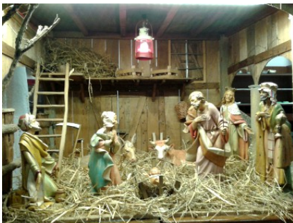
Foto del presepe in chiesa su www.parcchiaborgonuovo.it