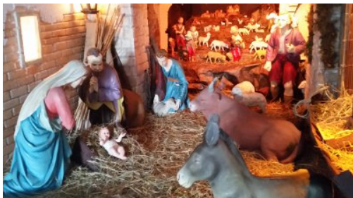
Foto del presepe parrocchiale e dei Presepi 2016 in www.parrocchiaborgonuovo.it